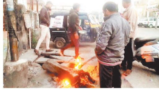
अलाव तापते लो।

नये वर्ष की शुरुआत शीतलहर से शुरू हुई है। दो दिन तेज धूप होने से ठण्ड से कुछ राहत मिली थी लेकिन बीते 4 दिन से शीतलहर ने समुचे अंचल को चपेट में ले लिया है। शहर के मार्केट जो सुबह 9 बजे के बाद खुलने शुरू हो जाते थे अब उनके खुलने का समय भी ठण्ड की वजह से 10 बजे तक हो गया है। वहीं रात 8 बजे के बाद मार्केट में रौनक खत्म होने के कारण दुकानें बंद करने की स्थिति होने लगी है। शीतलहर के कारण आम जनजीवन भी प्रभावित हुआ है। ग्रामीण अंचलों से जिला मुख्यालय आने वाले ग्रामीण दिन ढलने के पहले ही अपने घरों को लौटने