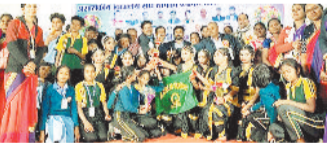
कार्यक्रम के मुख्य अतिथि कटघोरा

कोरबा। अशासकीय स्कूल संघ दीपका द्वारा शिक्षक-शिक्षिकाओं के सम्मान में एक भव्य सांस्कृतिक कार्यक्रम का आयोजन किया गया। कार्यक्रम में शिक्षा जगत से जुड़े शिक्षकों ने उत्साहपूर्वक सहभागिता निभाई और अपनी प्रतिभा का प्रदर्शन किया।