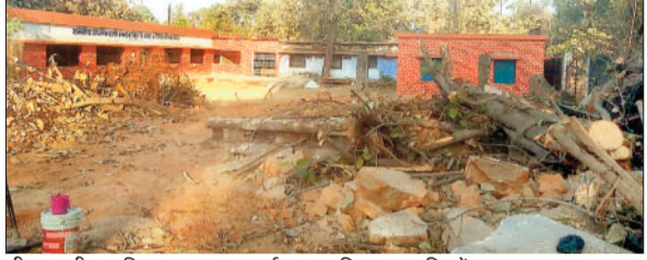
पीडब्ल्यूडी प्राथमिक स्कूल का जर्जर भवन किया गया डिस्मेंटल।