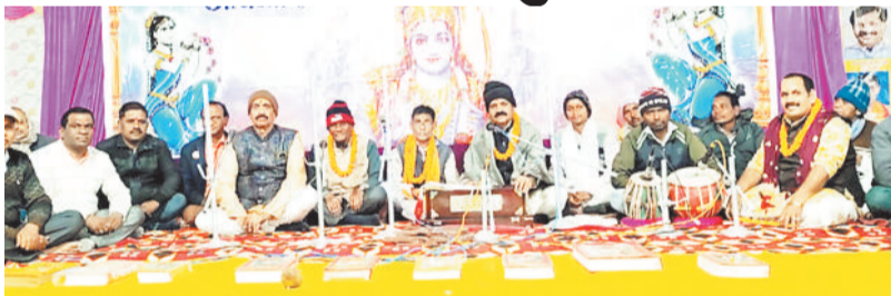
नवधा रामायण का हुआ शुभारंभ।