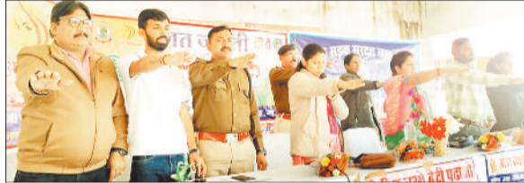
शाय लेते अतिथि और अधिकारी।