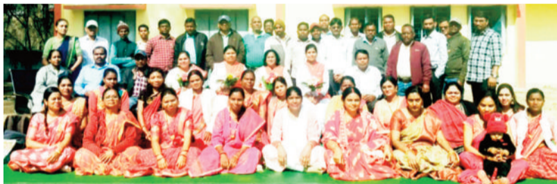
प्रशिक्षण में शामिल शिक्षक।