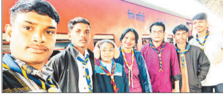
जिले से दो सौ से अधिक संख्या वाला दल जम्बूरी में सम्मिलित होने मंगलवार को रवाना हुआ। जम्बूरी के शुभारंभ

कोरबा। प्रथम राष्ट्रीय रोवर रेंजर जम्बूरी में भागीदारी करने जिले का दल मंगलवार को दुधली, बालोद के लिए रवाना हुआ। भारत स्काउट्स एवं गाइड्स, राष्ट्रीय मुख्यालय, नई दिल्ली द्वारा छत्तीसगढ़ की मेजबानी में प्रथम राष्ट्रीय रोवर रेंजर जम्बूरी का आयोजन किया जा रहा है। यह जम्बूरी दुधली, बालोद में 9 से 13 जनवरी तक आयोजित है। जम्बूरी में मेजबान छत्तीसगढ़ के अलावा देशभर से सीनियर स्काउट्स, गाइड्स, रोवर्स, रेंजर्स तथा लीडर्स की भागीदारी हो रही है।