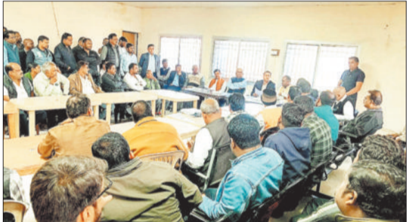
बैठक में उपस्थित एसईसीएल के अधिकारी और भूविस्थापित ग्रामीण।

उल्लेखनीय है कि एसईसीएल दीपका प्रबंधन के लिए प्रभावित ग्राम हरदीबाजार के अधिग्रहण का रास्ता साफ होता नहीं दिख रहा है। सभी मुख्य 9 मांगों पर प्रबंधन, जिला प्रशासन व ग्रामीणों के बीच पूर्ण सहमति नहीं बनने से ग्रामीणों में नाराजगी देखने को मिली। चर्चा के दौरान वर्ष 2004 के बाद जन्मे बच्चों को नौकरी नहीं देने का मामला न्यायालय में लांबित होने वर्ष 2004 से